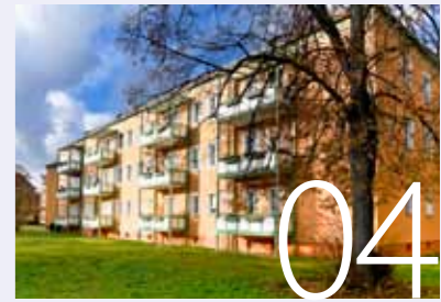
Echt starke Bauvorhaben 2023