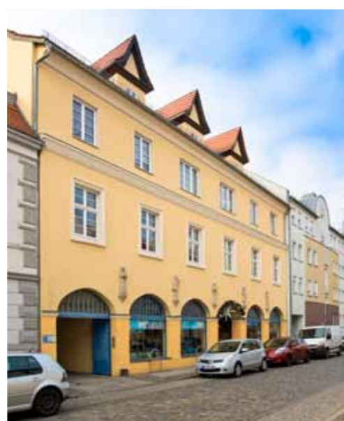
(kein Energieausweis, da Baudenkmal)