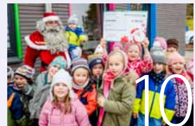
Vorweihnachtliche Bescherung in Hoyerswerda