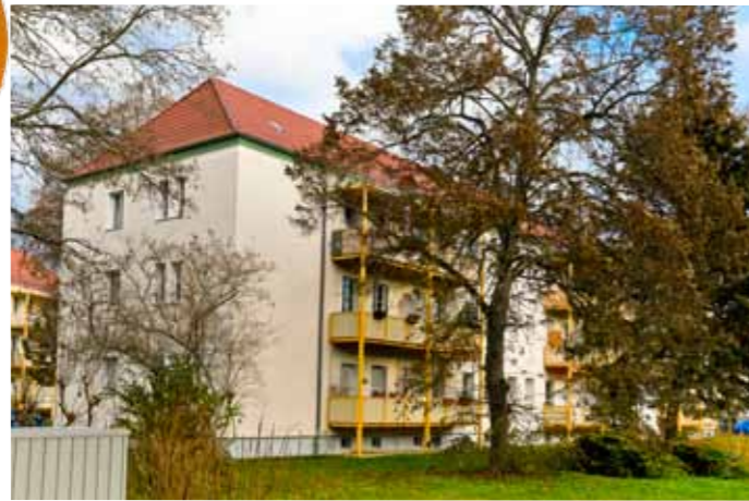
(kein Energieausweis, da Baudenkmal)