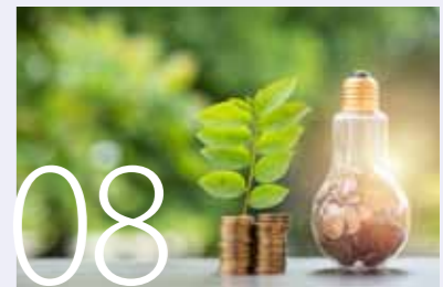
Gewusst wie - spart Energie!