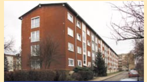
Richard-Wagner-Straße 1 – 9