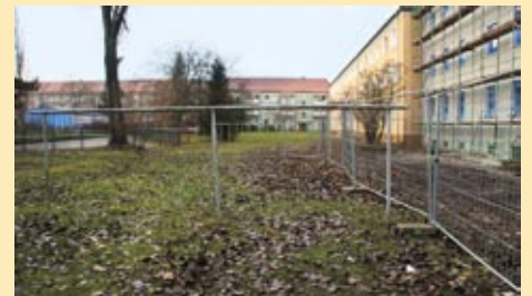
Gebr.-Grimm-Straße 2 a – c, 4 a – c