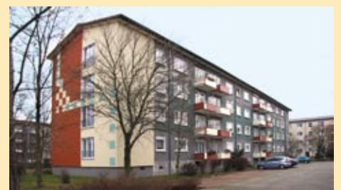
Hufelandstraße 8 – 12