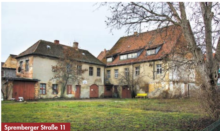
Spremberger Straße 11

tion und benutzerfreundliche Umgestaltung der Personenaufzüge wird dieses Wohnhaus besonders ältere Bürger ansprechen. Die Eingänge 25 und 31 sowie die gesamte Fassade sollen im Jahr 2011 bautechnisch fertig gestellt werden.