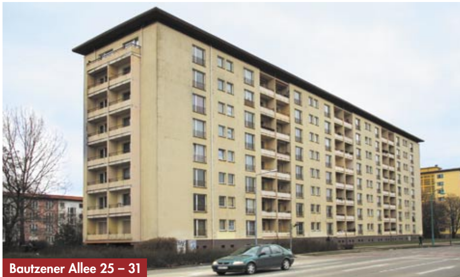
Bautzener Allee 25 – 31

Im Jahr 2010 wird die Modernisierung im WK III mit dem Wohnhaus Bautzener Allee 25 – 31 fortgeführt. Zunächst werden die beiden Eingänge 27 und 29 saniert. Durch die Änderung von Wohnungsgrundrissen, den Anbau von zusätzlichen Balkonen sowie die Rekonstruk-